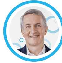
RAMON LAGUARTA PepsiCo Yönetim Kurulu Başkanı ve CEO Haziran 2020

Ancak birlikte çalışarak eskisinden daha güçlü, daha sürdürülebilir bir gıda sistemi ve herkes için daha parlak bir gelecek ile mevcut krizden çıkabiliriz.